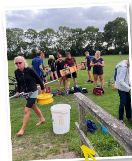
Kaatsen in Boksum - méér dan sport