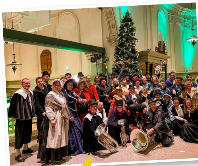
Scrooge in Menaam