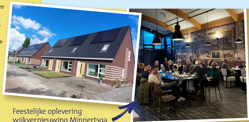
Feestelijke oplevering wijkvernieuwing Minnertsga

In opdracht van Wonen Noordwest Friesland heeft Friso Bouwgroep 25 nieuwe huurwoningen in Minnertsga gebouwd. Het gaat om vijf nieuwe woningen aan de Vikarijbuorren en 20 nieuwe woningen aan de Fjildleane en Collot d'Escurystrjitte. Vier van deze woningen zijn levensloopgeschikt. De andere 21 woningen zijn geschikt voor 1 á 2 personen. De huizen zijn energiezuinig en duurzaam. Ze zijn voorzien van radiatoren op lage temperatuurverwarming en beschikken over een lucht-warmtepomp. Ook liggen er zonnepanelen op het dak. De woningen hebben geen gasaansluiting. De bewoners zijn erg enthousiast en tevreden over hun woning. 'Het ziet er prachtig uit' aldus de nieuwe bewoners. Ook de architectuur wordt gewaardeerd, 'leuk zo met die dakkapellen, dat geeft een speels effect en voor de bewoners veel ruimte boven'.