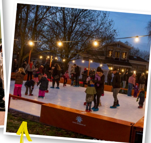
Sexbierum in kerstsferen