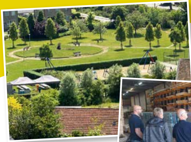
Bezoek aan Empatec