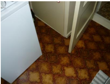
Voorbeelden asbesthoudend vloerzeil

Als uw woning voor 1983 is gebouwd, dan kan er asbesthoudend vloerzeil aanwezig zijn. Ook is het mogelijk dat er restanten van aanwezig zijn in de lijmresten. Dit komt meestal in de keuken voor. Als u vermoedt dat er asbesthoudend vloerzeil in uw woning aanwezig is, moet u dit meteen melden bij de opzichter. Hetzelfde geldt voor oude gevelkachels waarin vaak een asbestkoord is gebruikt. Als dit niet op de juiste manier wordt verwijderd dan kan de gehele woning besmet raken. Na uw melding laten wij het vloerzeil of restanten of oude gevelkachels op een verantwoorde manier verwijderen. Wonen Noordwest Friesland betaalt in dat geval de kosten hiervoor. Verwijder deze onderdelen niet zelf! U loopt dan (grote) gezondheidsrisico's en bovendien stellen wij u in dat geval aansprakelijk voor de kosten i.v.m. de besmetting. Deze kosten kunnen oplopen tot € 7.500 .